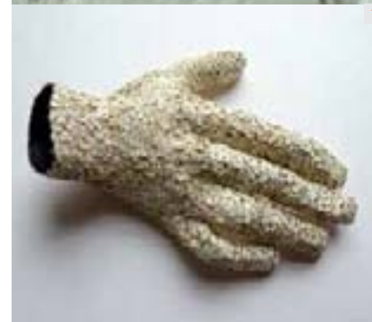
5 SEBASTIAN BRAJKOVIC Lathe IX 2010 Bronze, tissu, soie 94 x 146 x 75 cm Edition limitée en 8 exemplaires + 4 EA