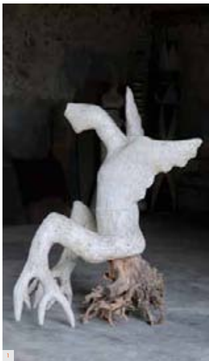
1 AGNES DEBIZET Esprit Migrant 2006 Grès engobe porcelaine Souche bois 150 x 80 x 105 cm

Le dogme de l'Immaculée conception de l'art qui s'est imposé dans l'institution artistique depuis des décennies sous la forme d'un consensus, de l'école au musée d'art contemporain en passant par les centres d'art et l'inspection artistique, paraît cependant sur le point de se fissurer.