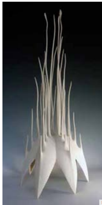
3 ALEV EBUZZIYA SIESBYE Bol 2008 Grès, email 10,5 x 12,5 cm