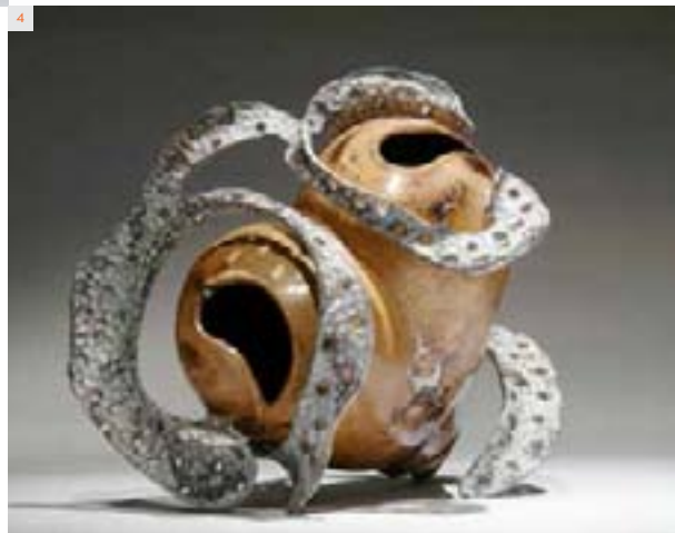
4 CHRISTOPHE NANCEY Selva 2013 Loupe de chêne, inclusions d'étain, polychromie 35 x 30 x 25 cm