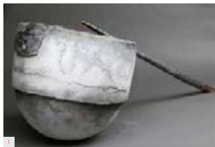
2 CHRISTOPHE COME Lampe Double Loukoum 2013 Acier patiné, verre massif 21 x 21 x 34 cm